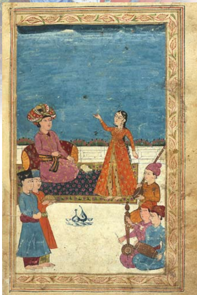
Персидская миниатюра. VI в.

— Некоторые богини живут столько, сколько их чтят, и умирают вместе со своими поклонниками, другие живут вечно и бесконечно. Жизнь мою поддерживает мир Красоты, которую ты можешь увидеть повсюду, куда бы