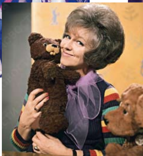
В. Леонтьева — ведущая телепередачи «Спокойной ночи, малыши»