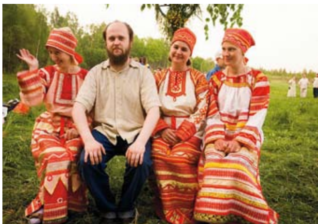
Самодельные фольклорные исполнители. Россия

В дни праздников наши предки, как и мы сегодня, не обходились без танцев, которые сопровождалась игрой на многочисленных народных инструментах. До наших дней дошли известные плясовые наигрыши: «Калинка», «Барыня», «Камаринская» и др.