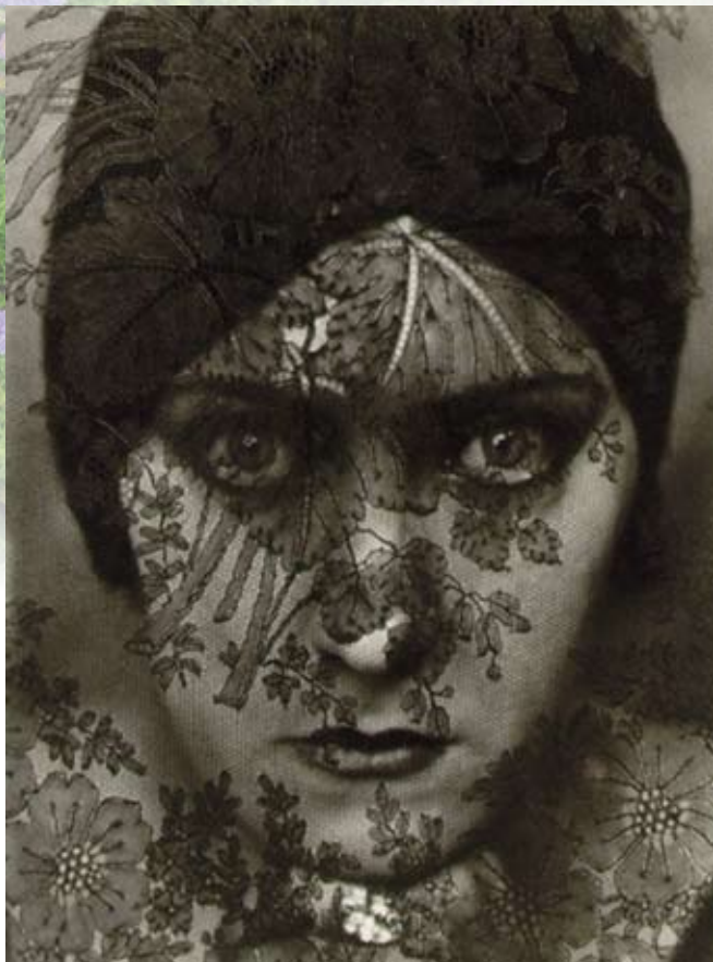
Э. Стейхен. Глория Свенсон