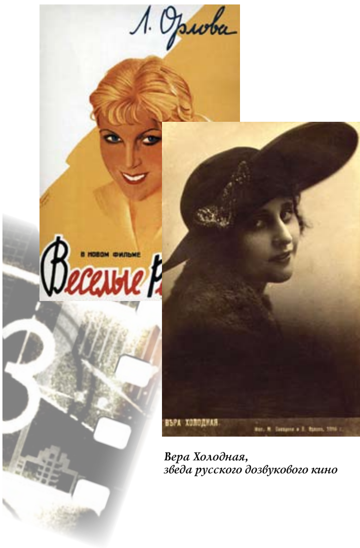
Вера Холодная, звезда русского дозвучкового кино

Кино сегодня является одним из самых массовых видов искусства.