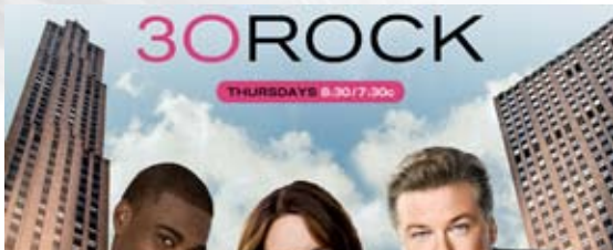
Заставки популярных американских телепроектов