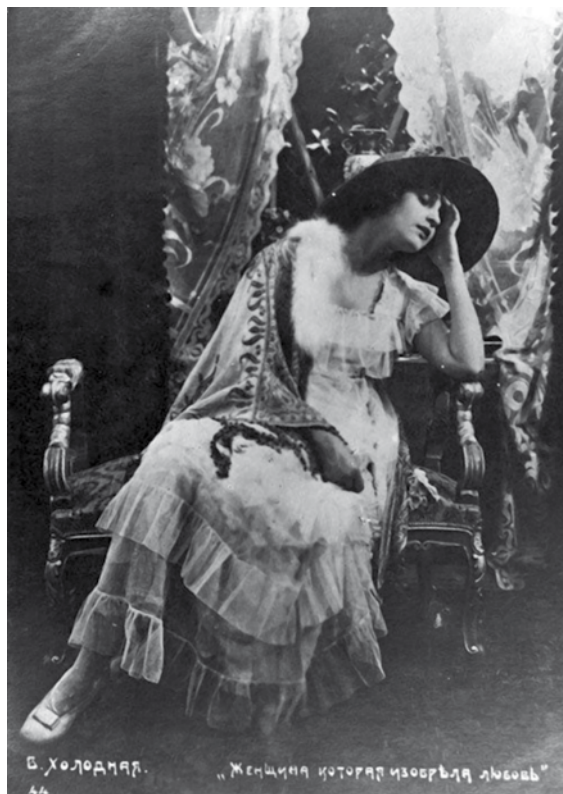
Кадр из кинофильма «Женщина, которая изобрела любовь»