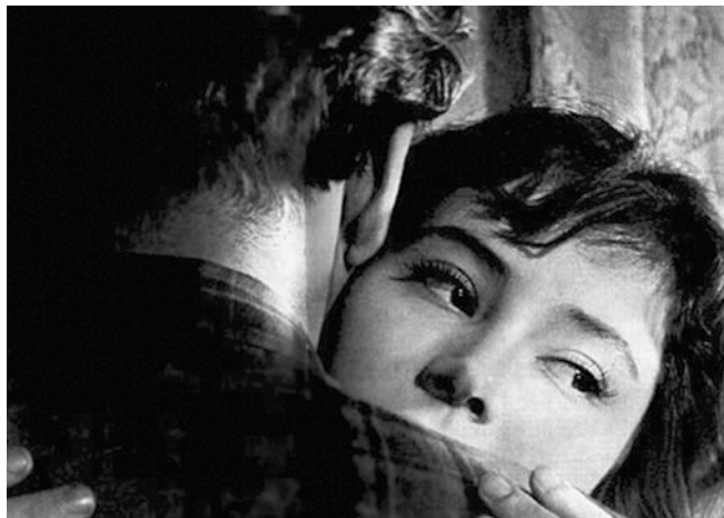
Кадры из кинофильма «Летят журавли»

Значимыми в фильме становятся язык образов, психологизм героев, повторы деталей, ракурсов, отсылки к прежним временам, к воспоминаниям, которые заставляют зрителя взглянуть на мир глазами Вероники, ощутить движение ее души.