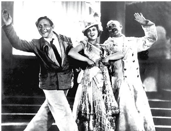
Кадр из кинофильма «Веселые ребята»