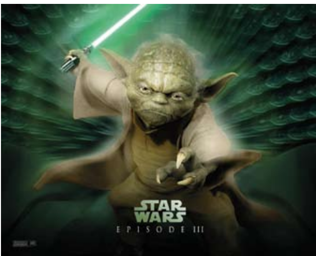
Кинофильм «Звездные войны». Рекламный постер

вам кинорежиссера В. Пудовкина, монтаж — это «найденный и развиваемый киноискусством метод выявления и ясного показа... связей, существующих в реальной действительности».