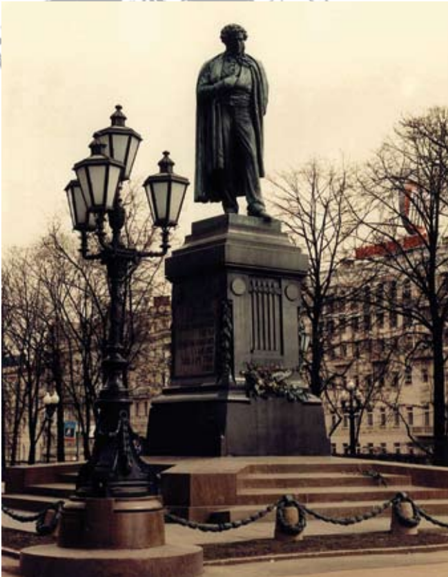
Памятник А. С. Пушкину на Тверском бульваре