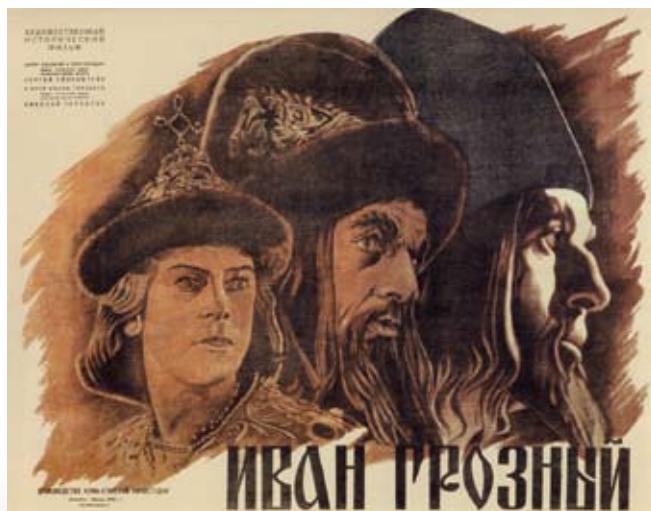
Прокатный плакат кинофильма «Иван Грозный»