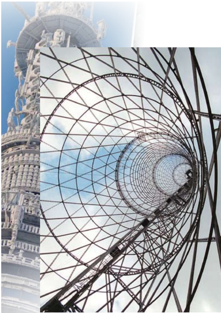
Шуховская башня. Москва