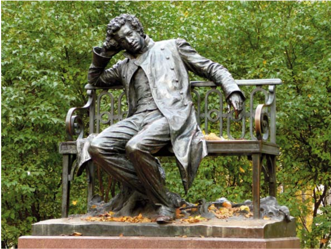
Памятник А. С. Пушкину в Царском Селе