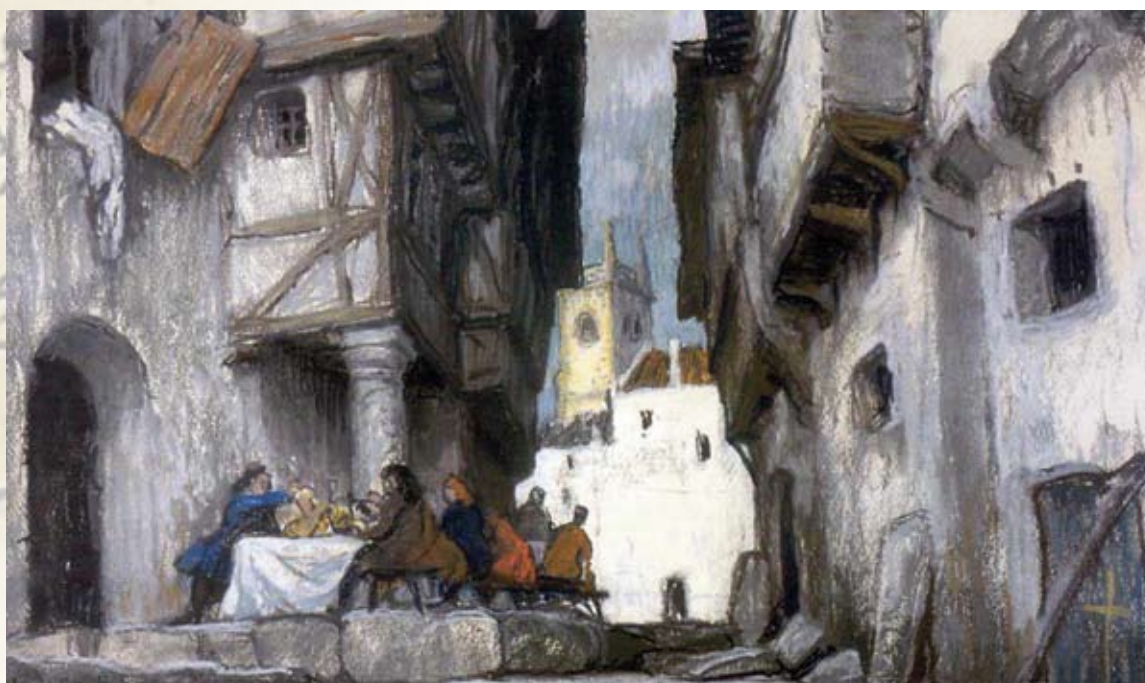
А. Бенуа. «Пир во время чумы»

искусств, в которых воплощены образ самого поэта и образы его литературных произведений. Представьте изученный вами материал в виде реферата, компьютерной презентации, виртуального путешествия по пушкинским местам.