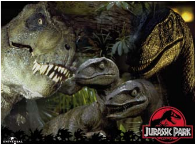
Кинофильм «Парк Юрского периода». Рекламный постер