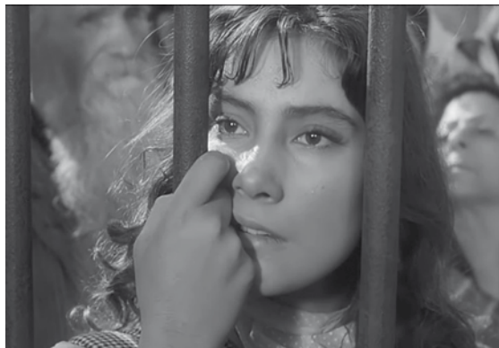
Кадр из кинофильма «Летят журавли»

Каждое произведение искусства создает неповторимую модель мира. Более полувека назад (в 1957 г.) появился на свет художественный фильм «Летят журавли» (режиссер М. Колотозов, оператор С. Урусевский), который снискал заслуженную славу и в отечественном, и в зарубежном кинематографе. Пальмовая ветвь Международного Каннского кинофестиваля приравняла ленту к шедеврам таких признанных мастеров, как Ф. Феллини и М. Антониони (Италия).