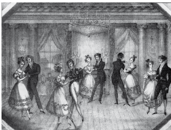
Котильон. Старинная гравюра