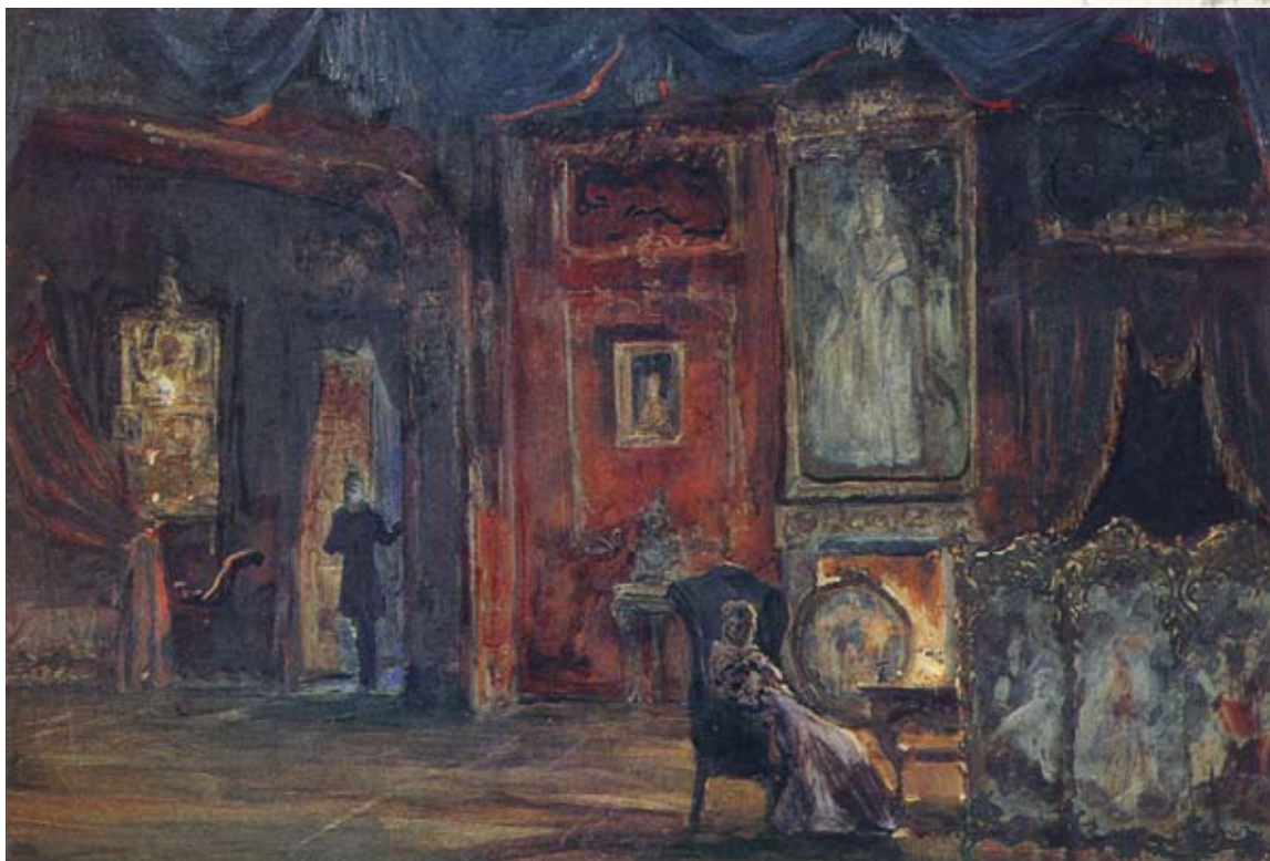
И. Глазунов. Пиковая дама