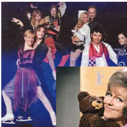
Телепроект «Танцы со звездами»

Процесс создания телевизионной продукции связан с коллективным творческим трудом сценариста, режиссера, оператора, художника, актеров, работников сопутствующих служб (осветителей, костюмеров, гримеров и пр.).