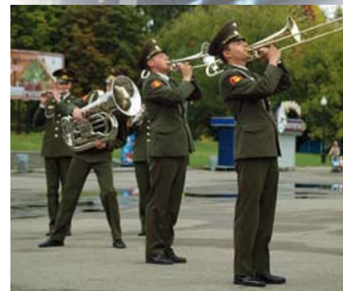
Духовой военный оркестр