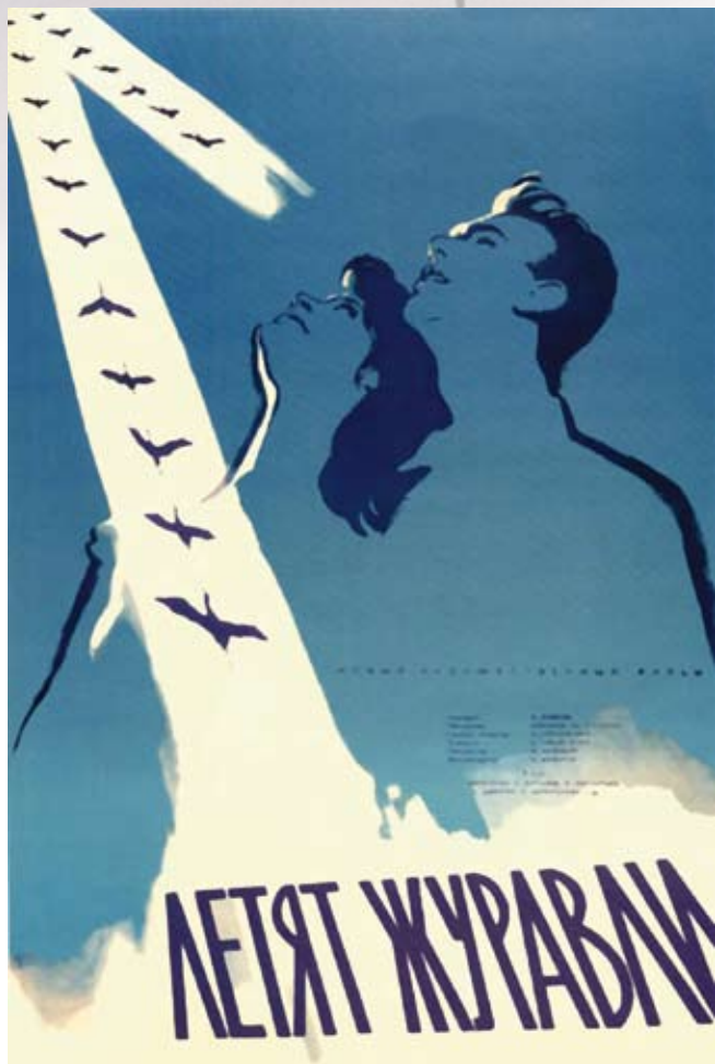
Прокатный плакат кинофильма «Летят журавли»