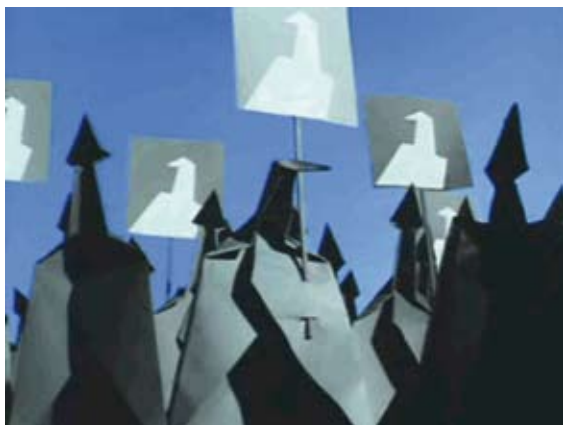
Гарри Бардин. Адажио

Символ движения стал исходной точкой для создания мультипликационного фильма. На фоне музыки «Адажио» разворачивается неторопливое действие, в котором режиссер (с помощью бумажной пластики) призывает зрителей осмыслить вечные темы — добро и зло, свет и тень, черное и белое, кумиры и поклонники, чужой среди своих и др.