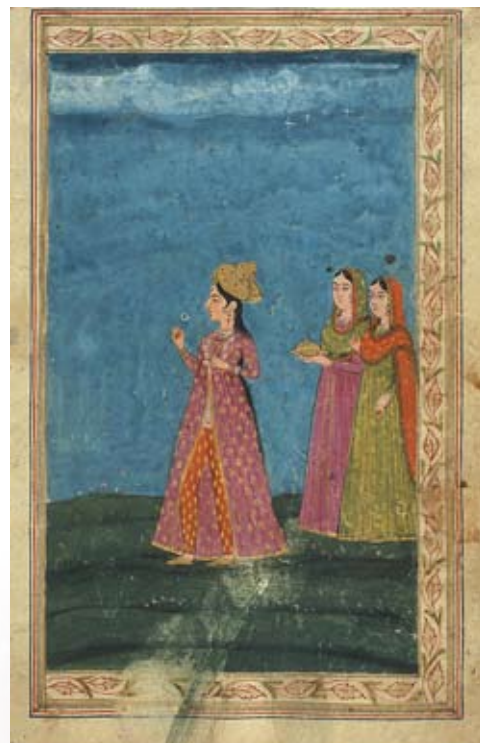
Персидская миниатюра. VI в.

• Найдите на страницах учебника репродукции произведений изобразительного искусства, вспомните полюбившиеся вам музыкальные и литературные произведения, кинофильмы и театральные постановки, которые, на ваш взгляд, созвучны мыслям прочитанной притчи.