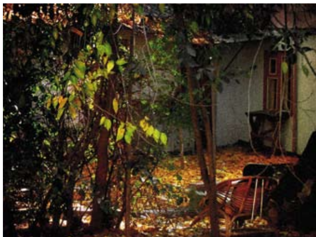
И. Судек. Осенний дворик

Сегодня техника фотографирования, пережив множество усовершенствований, достигла цифрового уровня. Компьютер помогает добиться необычайного эффекта в фотографии, дает возможность соединять различные объекты, трансформировать или частично менять форму, фактуру или цвет предметов, комбинировать объекты наподобие коллажа.