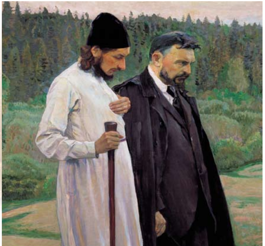
М. Нестеров. Философы