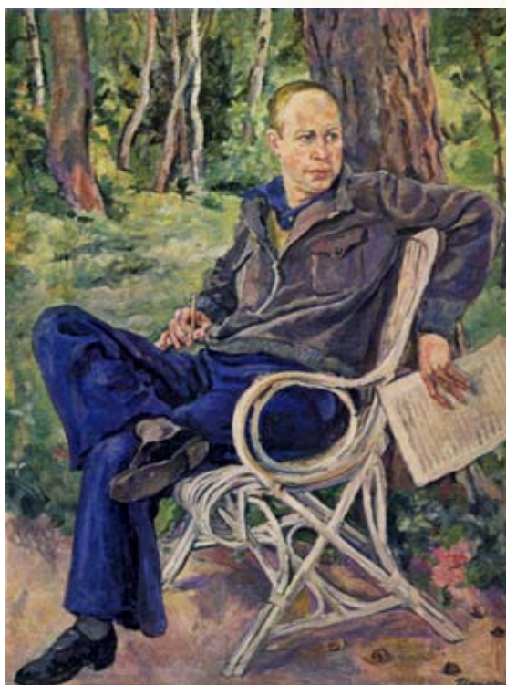
П. Кончаловский. Портрет С. Прокофьева