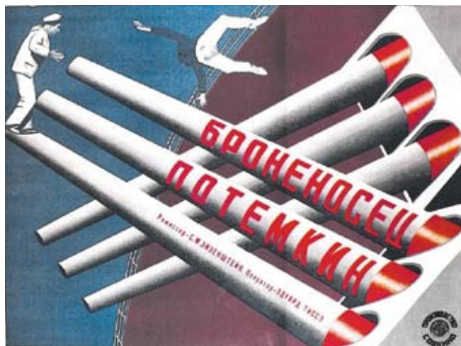
Прокатный плакат кинофильма «Броненосец Потемкин»

Объединяя литературу, театр, живопись, музыку, кино раскрывает динамичный целостный зрительно-слуховой образ эпохи. Едва ли не самая специфическая основа киноязыка — монтаж, т. е. расстановка кадров в определенной последовательности. Монтаж создает движение, выстраивает ритм картины, придает определенный смысл кадрам — снимкам-образам жизни. И в конечном счете служит прямым воплощением мысли автора, выражением художественной идеи фильма. По сло-