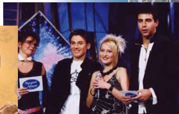
Телепроект «Народный артист»

• Изучив телевизионную программу одного из дней недели, систематизируйте передачи по жанрам, запишите свои выводы в творческую тетрадь.