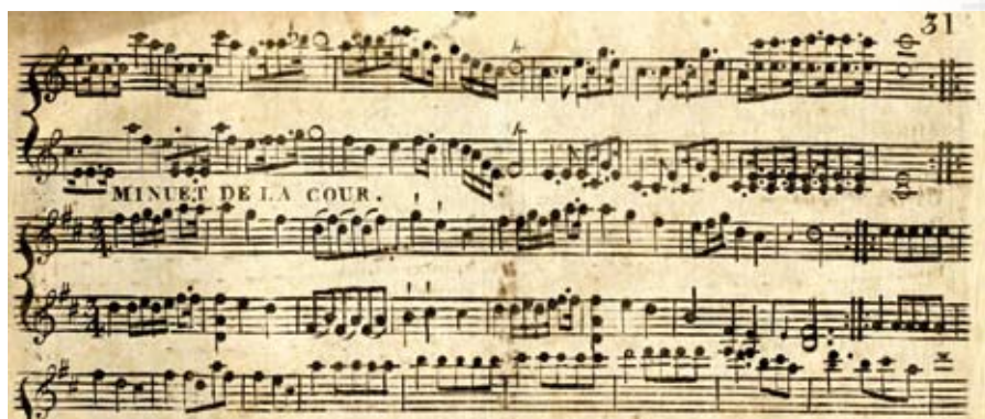
Менуэт. Рукописные ноты