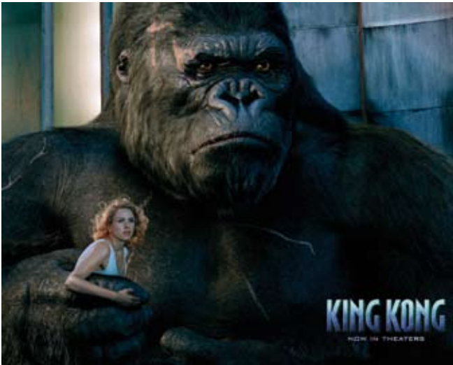
Кинофильм «Кинг Конг». Рекламный постер