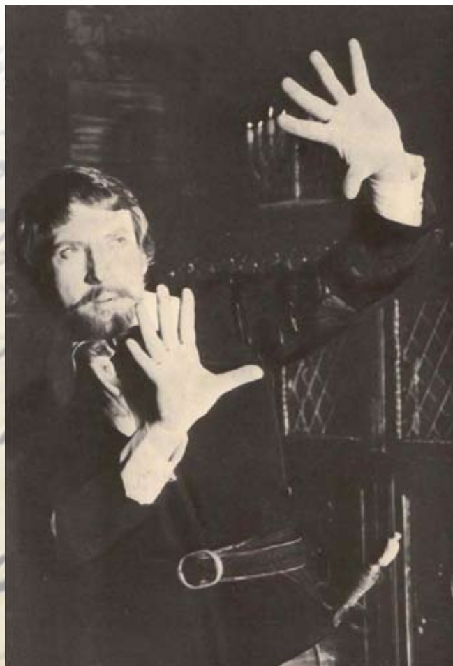
В. Высоцкий в роли Дон Жуана. «Каменный гость»