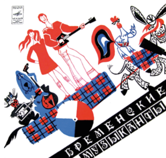
«Бременские музыканты». Конверт музыкальной пластинки

Фильм состоит из эпизодов . Каждый эпизод делится на кадры , которые характеризуются полем изображения, планом и углом съемки, составляющими особый язык кино. Кинорежиссер, меняя поле изображения, планы, ракурсы, последовательность монтажа кадров, а также особенности ритма, света, цвета, музыки, звука, создает целостный образ произведения.