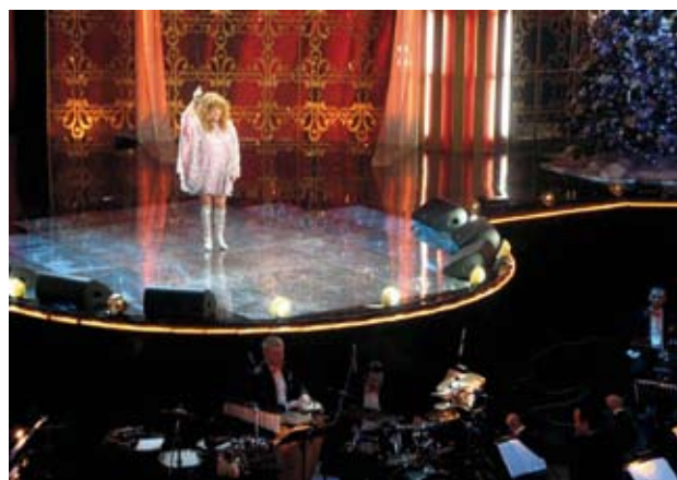
Телепроект «Две звезды»