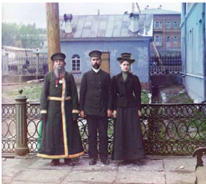
С. Прокудин-Горский. Фотография 1890-хх гг.

Огромную популярность в XX в. приобрели виды искусства, связанные с техническим прогрессом. Фотография, кино, телевидение, продукция полиграфической промышленности (книги, журналы, газеты) стали символами времени.