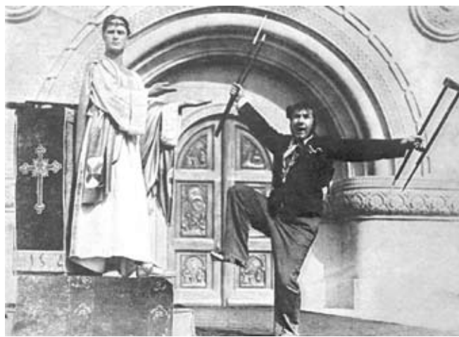
Кадр из кинофильма «Праздник святого Йоргена»

Кинематограф со временем стал важнейшим средством коммуникации. Кино доступно, увлекательно, выразительно. Оно обладает свойствами «зримой литературы», «движущейся живописи», «цветомузыки». Исходя из этого, можно сказать, что кино — синтез